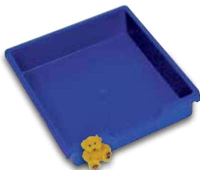
Il contenitore N1