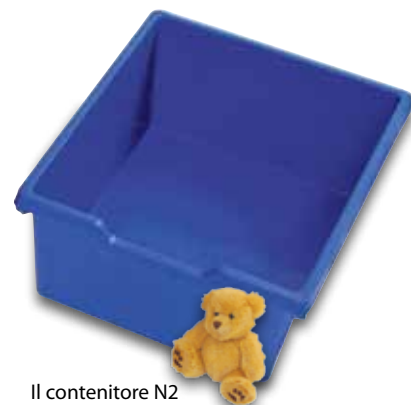
Il contenitore N2