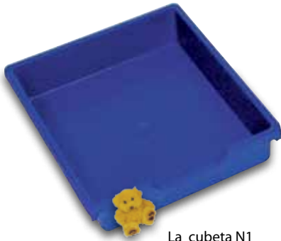
La cubeta N1