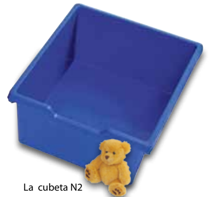
La cubeta N2